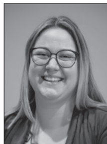
Florine Schuler Werbung