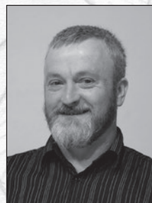
Regie Adrian Imholz