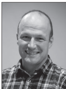
Walti Muheim Kiosk